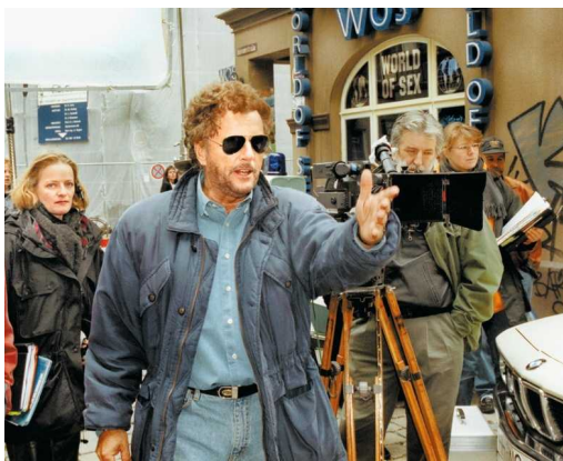
Dieter Wedel in Aktion: Hier am Münchner Set des «Königs von St. Pauli» im Jahr 1997. Alle wollten mit ihm arbeiten